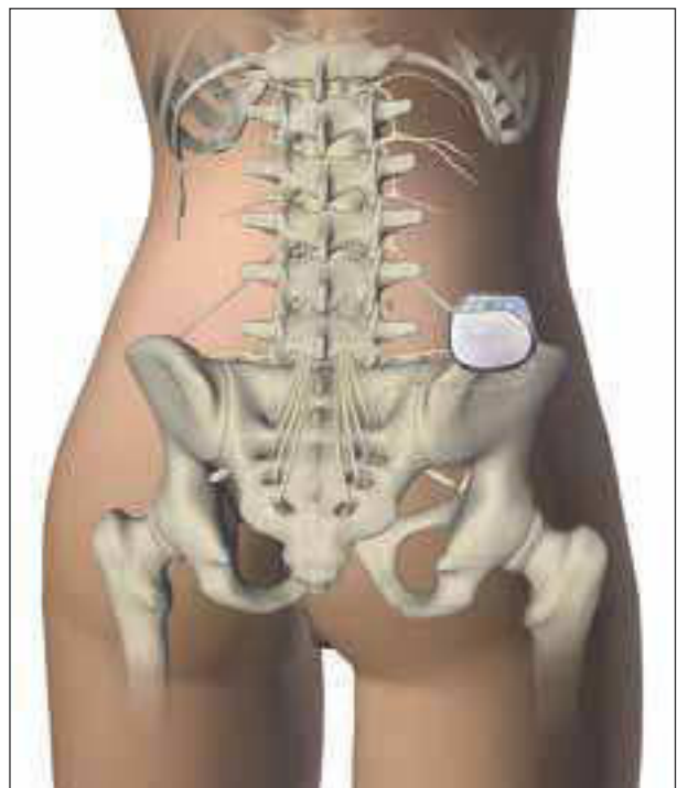
Implantat (sog. sakraler Neuromodulator)

In Zentren für Querschnittgelähmte mit entsprechender neurourologischer