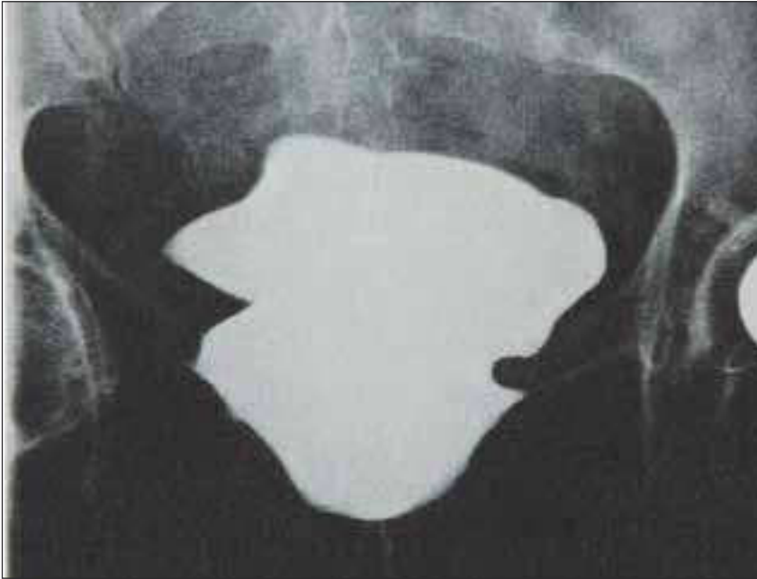
Röntgenbild einer Augmentatblase

Vorderwurzelstimulator steuern. Diese Operation ist bei komplett gelähmten Patienten mit spastischer Blase und ausgeprägten Blutdruckkrisen, Kopfschmerzen und /oder Schweißausbrüchen (sog. autonome Dysregulation), aber auch bei immer wieder auftretenden Harnwegsinfekten mit Verschlechterung der Nierenfunktion zu empfehlen.